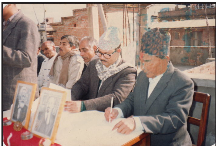
पार्टी एकीकरणको दस्तावेजमा हस्ताक्षर गर्दै क. अमात्य र क. माधव नेपाल, अन्य नेता मोहनचन्द्र अधिकारी, वामदेव गौतम, (२०५०/८/२९)