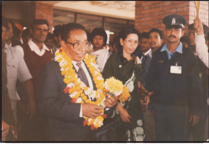
संयुक्त वाममोर्चाका मानार्थ अध्यक्ष अमात्य कोरिया भ्रमण पश्चात काठमाडौंमा स्वागत ग्रहण गर्दै (२०४७)