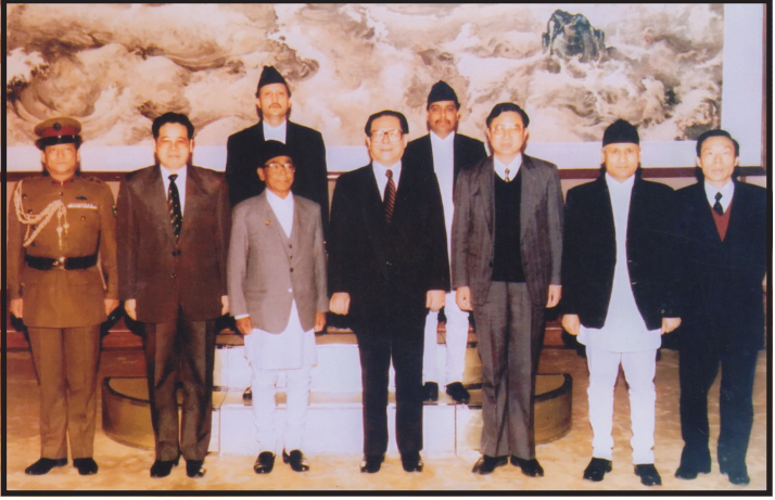
बेजिङ्गमा चीनीया राष्ट्रपतिका साथमा जनवादी गणतन्त्र चीनका लागि नेपालको महामहिम राजदूत भएको अवसरमा