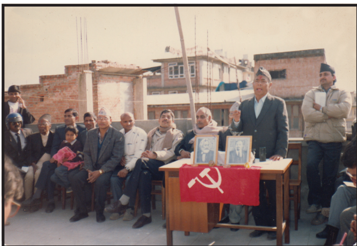
नेपाल कम्युनिष्ट पार्टी (एमाले) र नेकपा (अमात्य) का बीचमा पार्टी एकीकरणका अवसरमा सम्बोधन गर्दै (२०५०/८/२९)