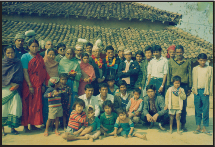
रौतहट जिल्लाका कार्यकर्ताका घरमा समर्थकहरुका बीचमा अमात्य