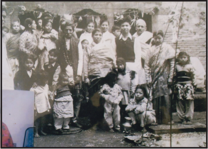
अमात्यका जेठा बा चक्रलाल, जेठी आमा गौरीमाया, काका काकी तथा परिवारका अन्य सदस्यहरू