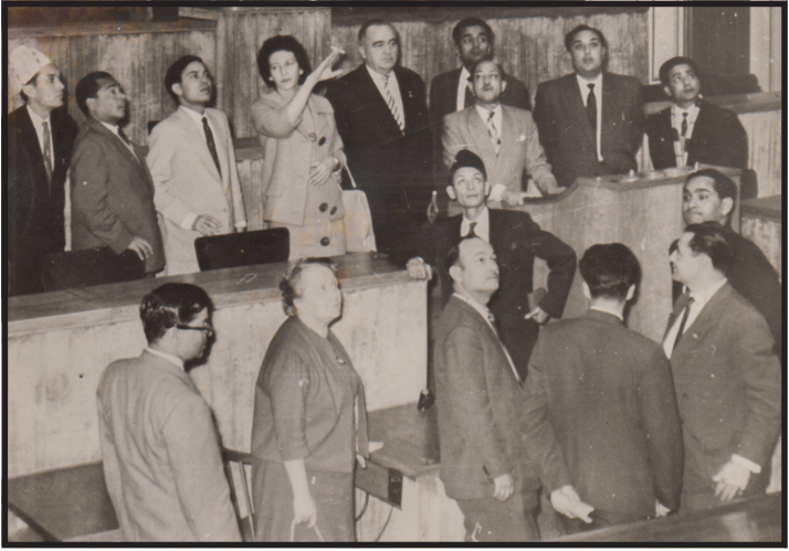
२०१५ सालमा सांसद भएको वेलामा सोभियत रुसको भ्रमणका अवसरमा