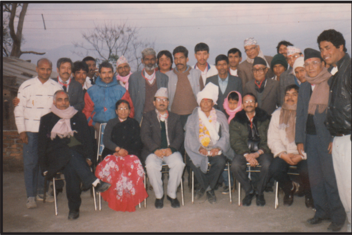
केपी शर्मा ओली, माधव कुमार नेपाल, मोहनचन्द्र अधिकारी, वामदेव गौतम, सिद्धिलाल सिंह आदि नेताका साथमा प्रथम जंकाँ ७७ वर्ष ७ महिना ७ दिन (भीमरथारोहण)