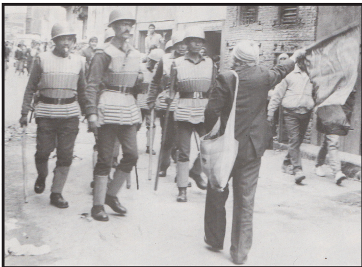
२०४६ साल फाल्गुण ७ गते प्रजातन्त्र पुनस्थापनाका लागि भएको संयुक्त जनआन्दोलनको नेतृत्व गर्दै काठमाडौं नयाँ सडकमा