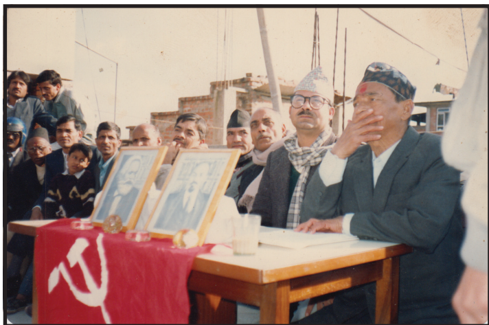
नेकपा (एमाले) र नेकपा (अमात्य) बीच २०५० साल मंसिर २९ गते एकता पछि गरिएको पत्रकार सम्मेलनमा माधव कुमार नेपाल, मोहन चन्द्र अधिकारी, अमृत बोहरा, वामदेव गौतम आदि नेताका साथमा