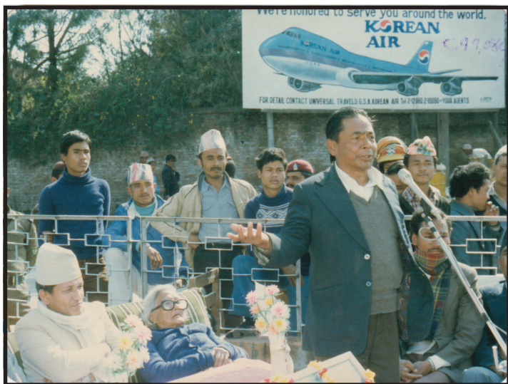
शहीद शुक्रराज शास्त्रीको स्मारिका उद्घाटन (२०४१/११/८)