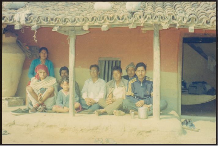
आफ्ना पुराना कार्यकर्ताको घरमा अमात्य