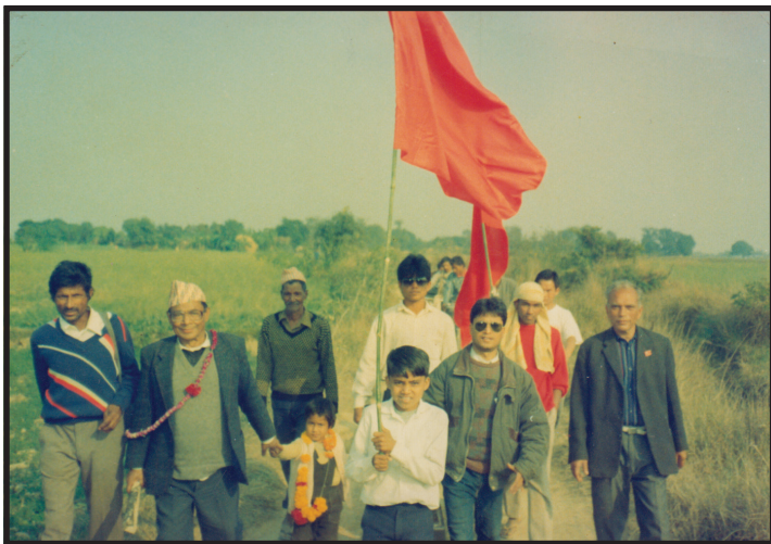
प्रचार अभियानमा पार्टी कार्यकर्तासँग अमात्य (२०५१)