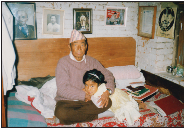
अमात्य आफ्नो अध्ययन कक्षमा नातिनीसँग