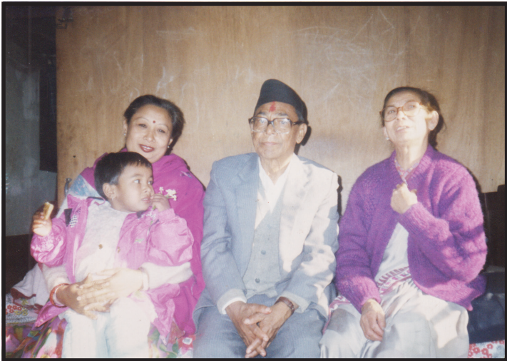
बहिनी र भाञ्जीका साथमा